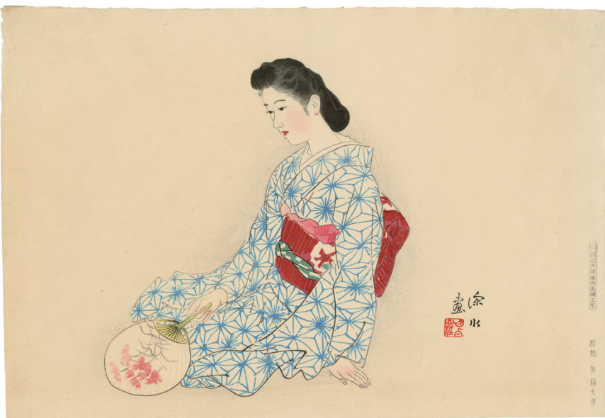
204. 大和なでしこ 昭和17年 刷保存優良 ¥160,000