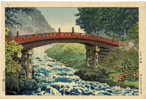
210. 日光神橋 ¥150,000 昭和14年 刷優良 マージンに少汚れ 馬場版