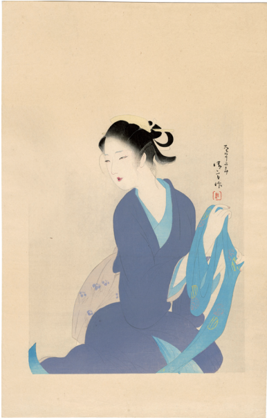
212. 大近松全集 鍵の権三重帷子のおさい ¥60,000 大正12年 45 × 28.6 cm 刷優良 少汚れ