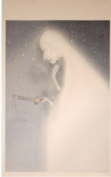
213. 大近松全集 雪女五枚羽子板の雪女 ¥61,000 大正11年 45 × 28.6 cm 刷優良 少ヤケ