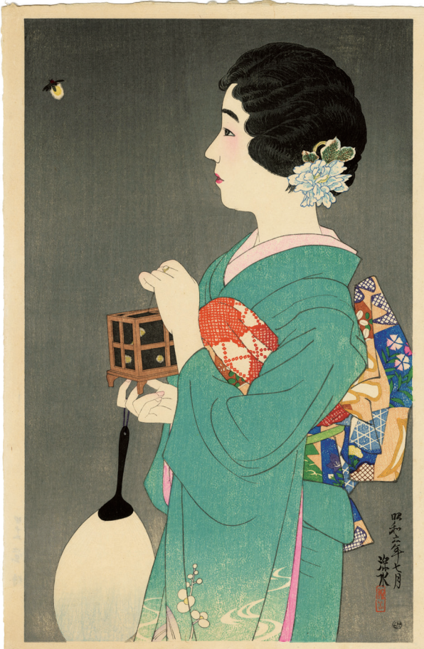
202. 現代美人集第一輯 蛭狩 ¥480,000 昭和6年 刷保存優良 ed.250