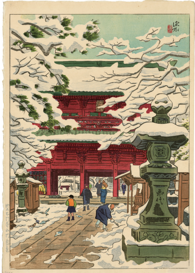
203. 池上本門寺山門雪景 ¥270,000 昭和15年 47.3 × 33 cm 刷保存優良 裏面にシール