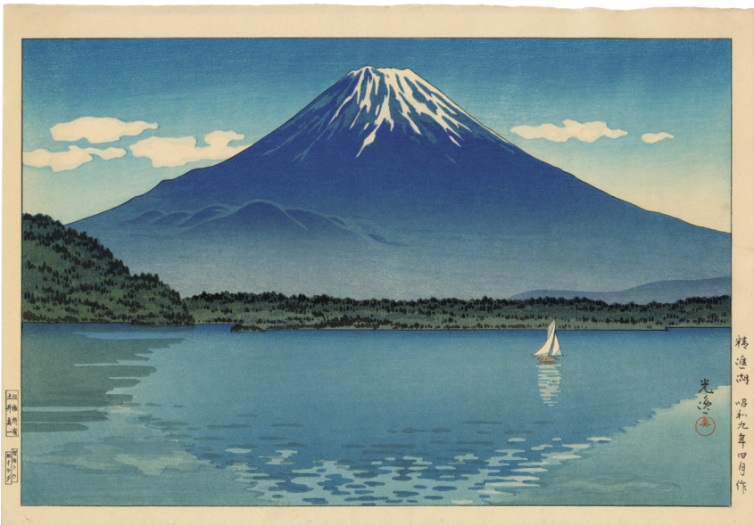
209. 精進湖 昭和9年 刷優良 マージンに少汚れ 版權所有土井貞一 ¥220,000