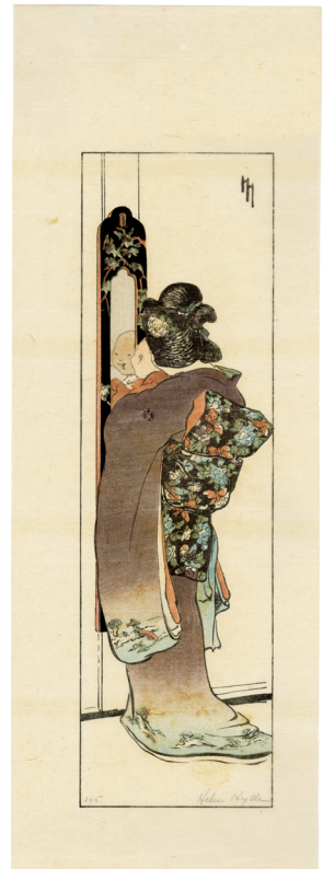
205. The Mirror 明治37年 48.2 × 17 cm 刷保存優良 雁皮刷 ¥240,000