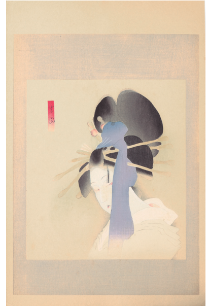
214. 大近松全集 夕霧阿波鳴渡の夕霧 ¥41,000 大正11年 45 × 28.6 cm 刷優良 少ヤケ