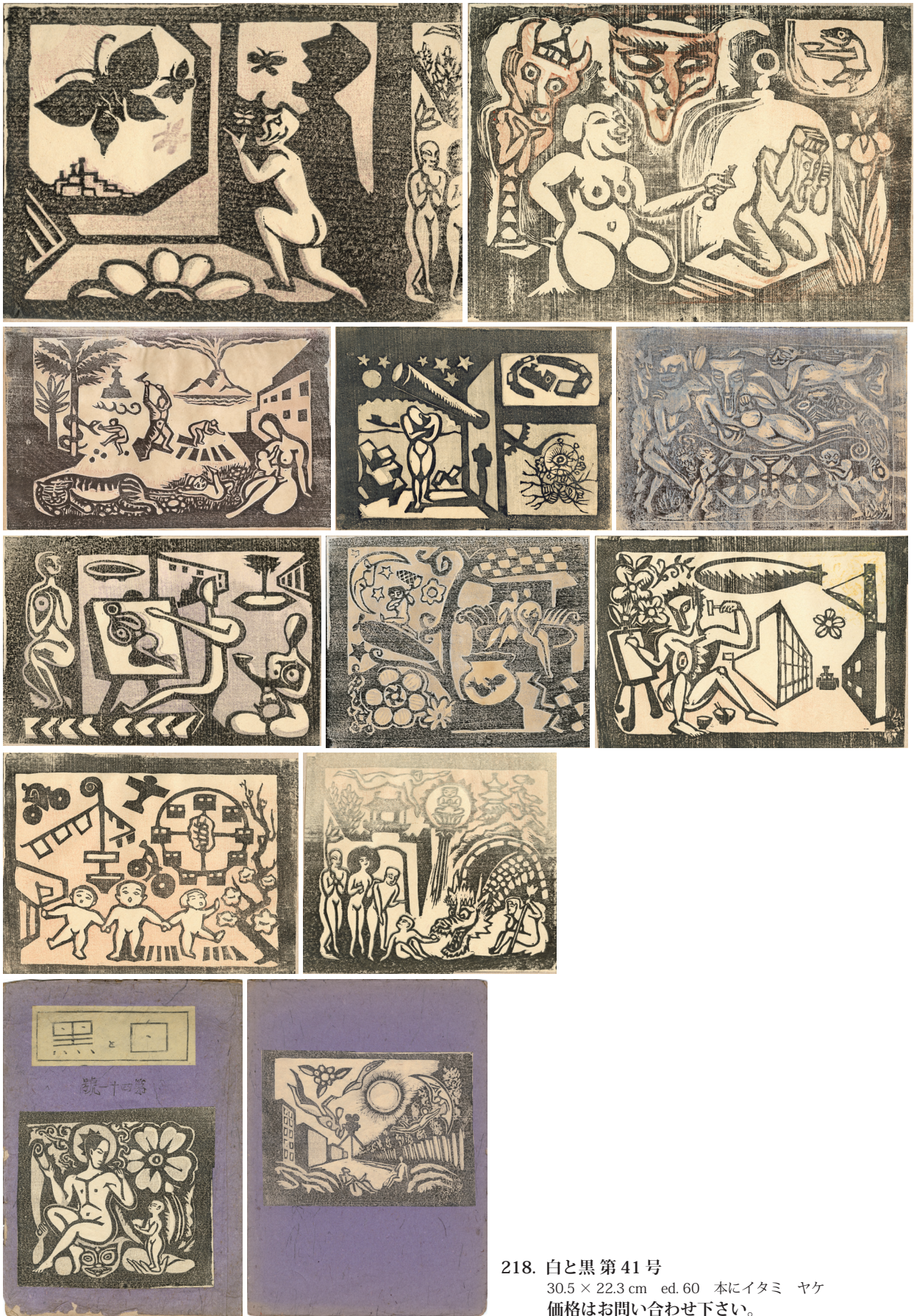
218. 白と黒 第41号