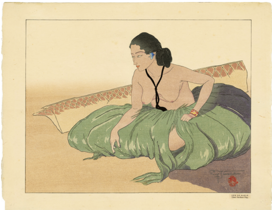
215. 砂の上ヤップ 西カロリン諸島 ¥260,000 昭和12年 36.3 × 46.8 cm 刷優良 ed. 150 (漢字エディション) 少汚れ