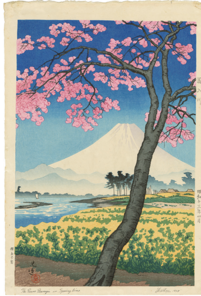
207. 馬入川 ¥100,000 昭和13年 刷優良 マージンに少汚れ 馬場版