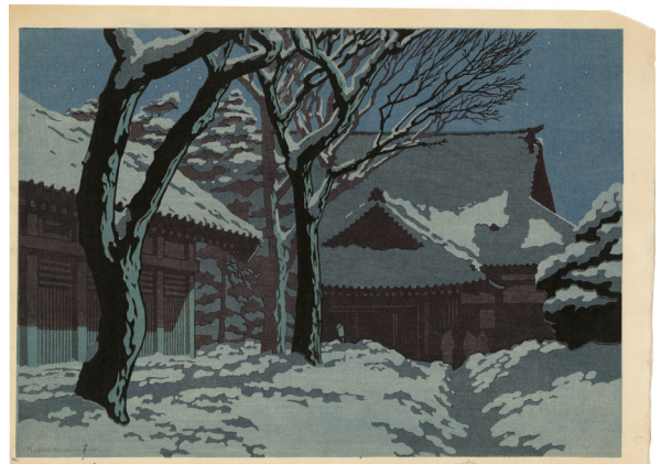
216. 東京の神社 刷優良 マージンに欠け ¥180,000