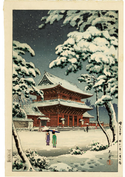
208. 増上寺の雪 ¥80,000 昭和8年 マージンに少シミ 東京堂版(土井版)