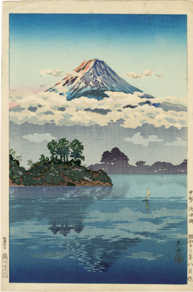
206. 甲州河口湖 ¥150,000 昭和13年 刷優良 マージンに少汚れ 馬場版