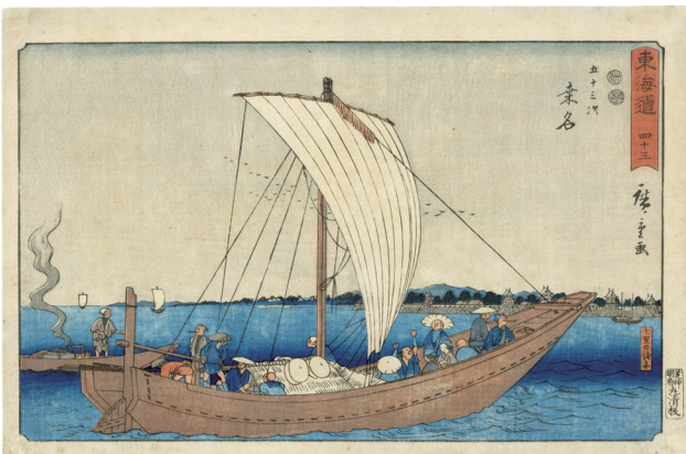
20. 東海道五十三次 (隸書) 桑名 ¥180,000 弘化 4 - 嘉永 5 年 刷優良 小虫穴補修