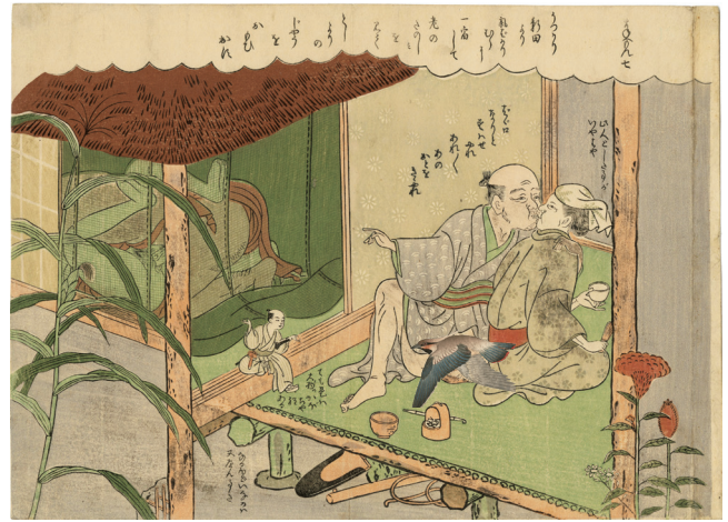
2. 七 端折 中折 小虫穴 ¥240,000