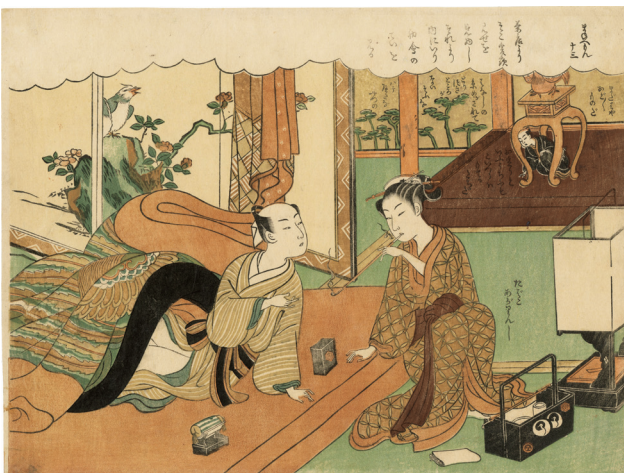
5. 十三 ¥500,000