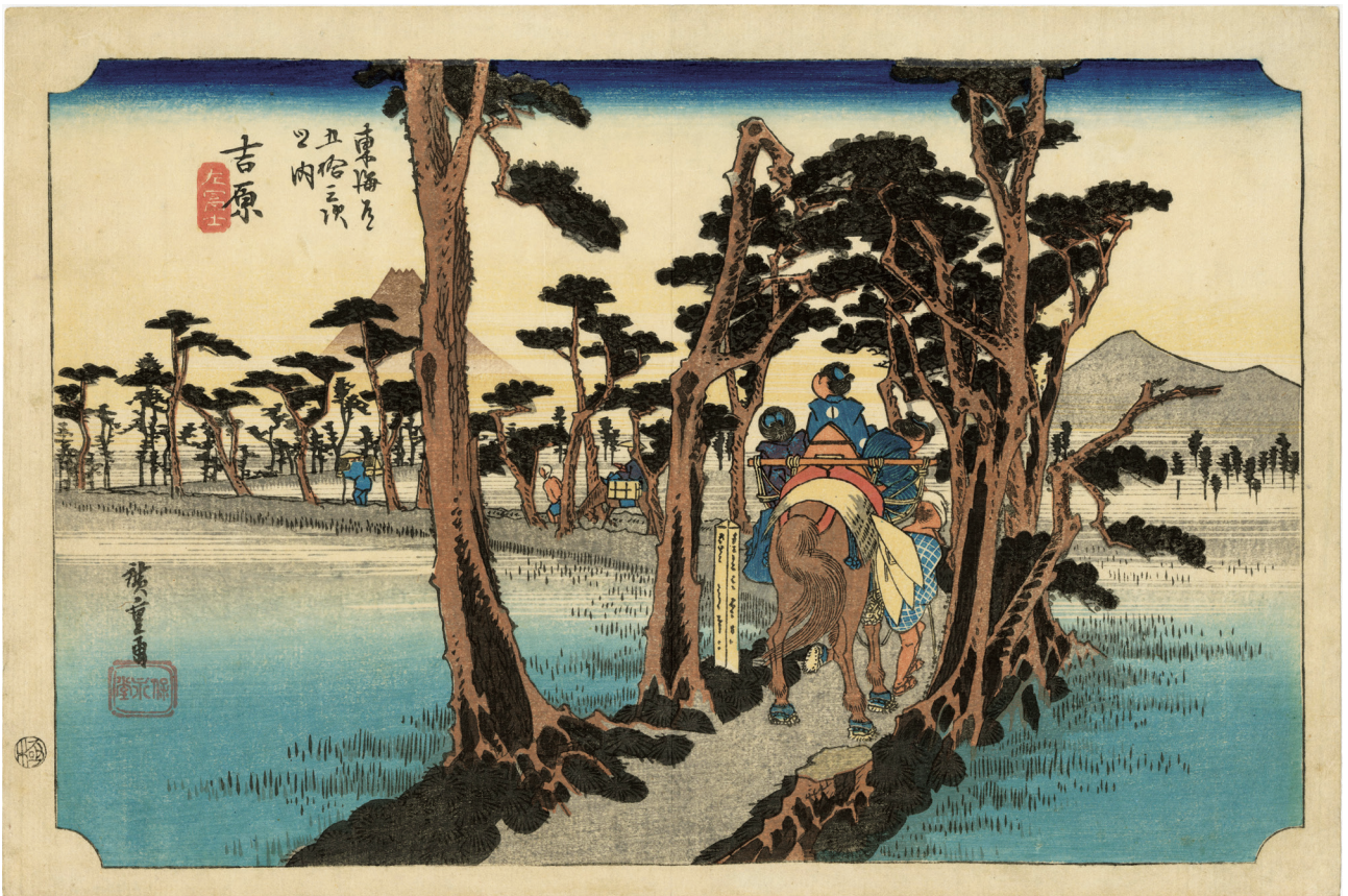
13. 東海道五十三次 (保永堂) 吉原 天保4年頃 刷優良 少汚れ 薄い中折 小虫穴補修

この作品は「一幽齋描きの東都名所」と呼ばれ、広重江戸風景の最初のシリーズとされている。藍と紅の調和が見事で、詩情のある名品揃いである。初版は外枠に繋ぎ模様がある。