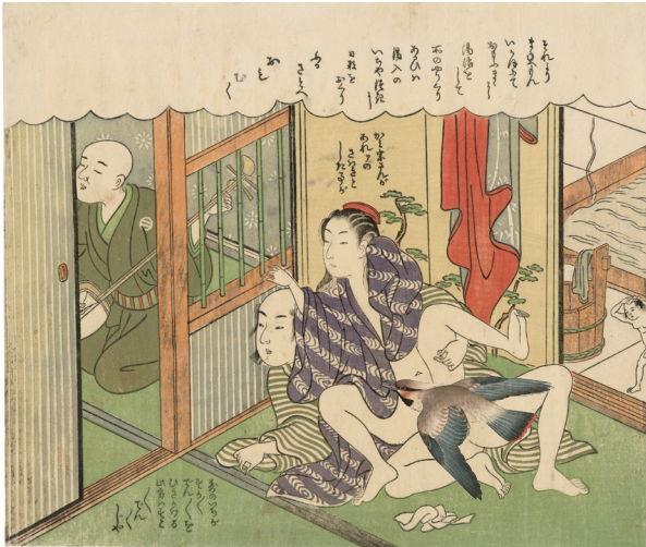
3. 八 小虫穴 少汚れ ¥400,000