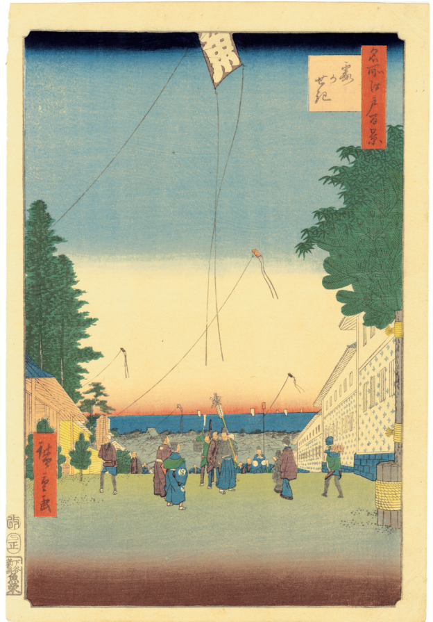
15. 名所江戸百景 霞がせき ¥350,000 安政4年 小虫穴補修