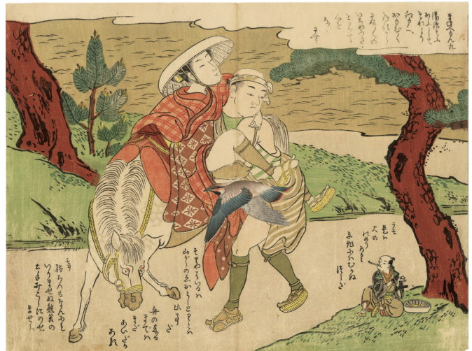
4. 九 中折 少汚れ ¥380,000