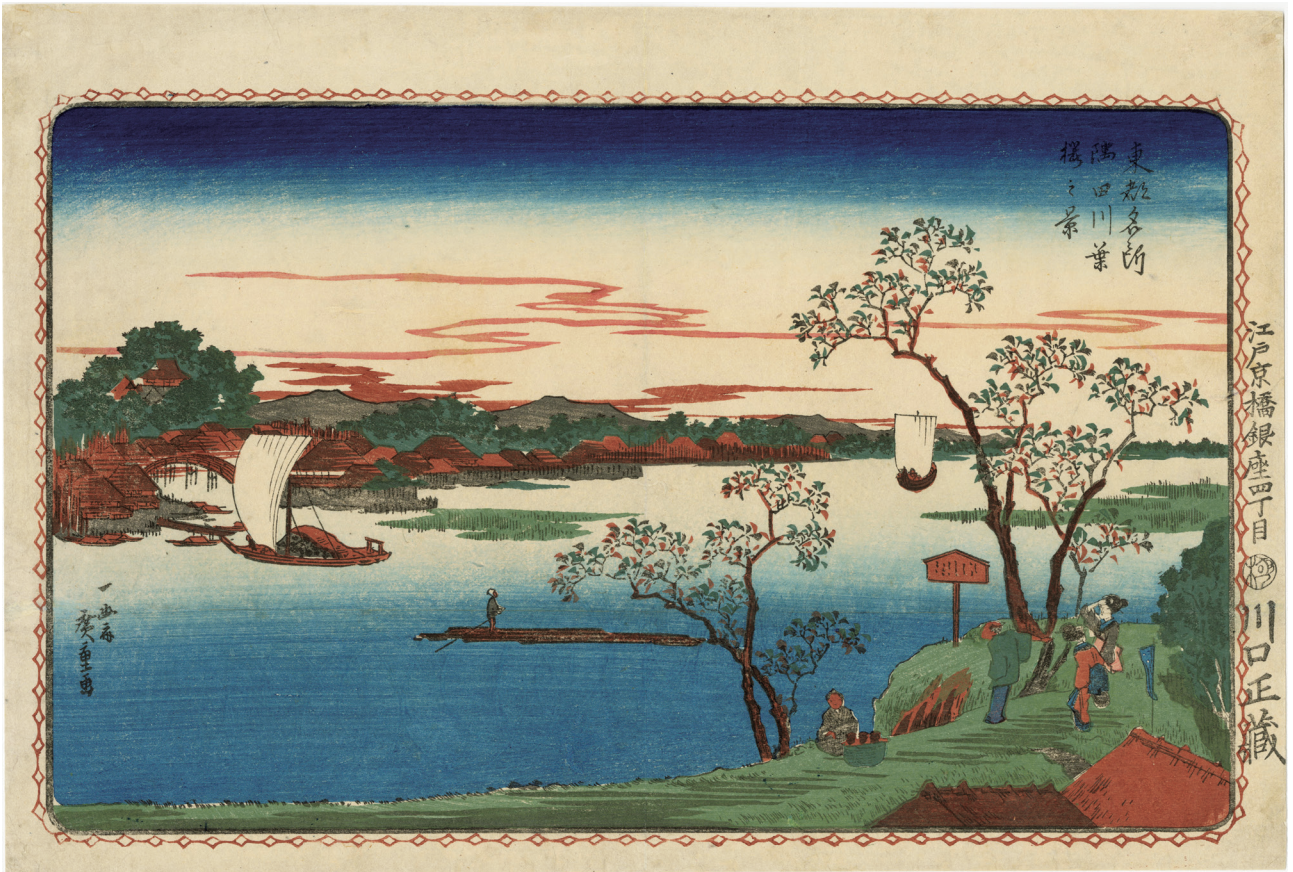
12. 東都名所 隅田川葉桜之景 天保2-3年 裏打