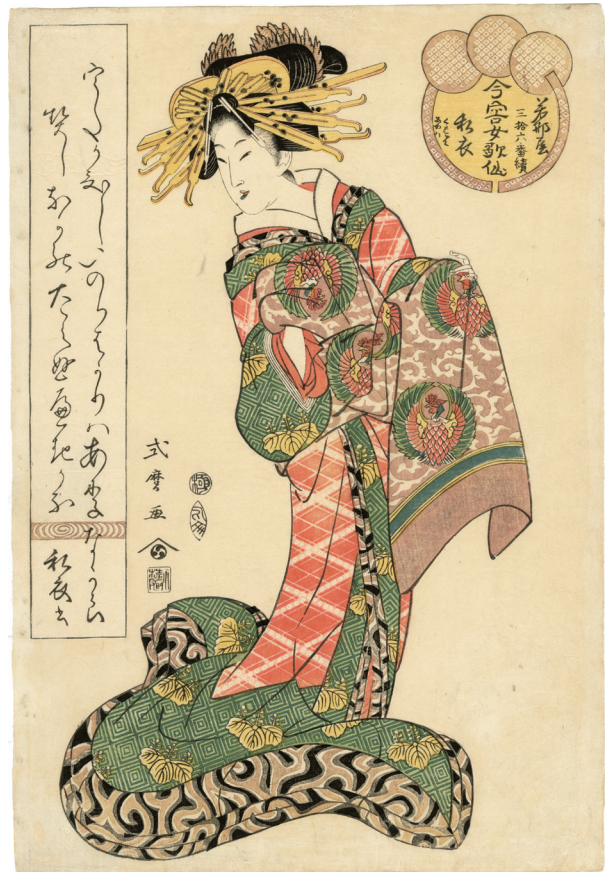
11. 今容女歌仙 若那 私衣くれはあやは ¥220,000 文化10年 少汚れ 綴穴補修