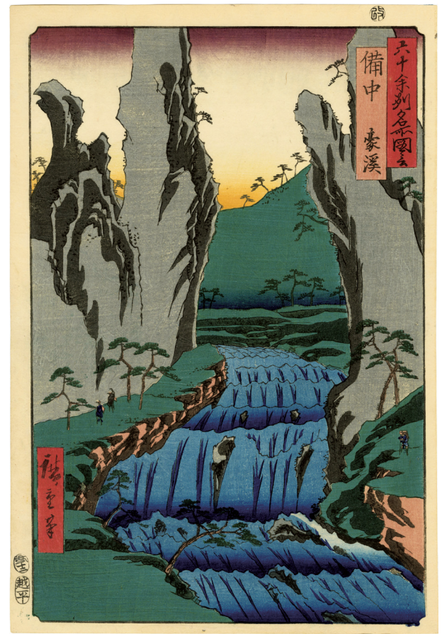
17. 六十余州名所図会 備中 豪溪 ¥340,000 嘉永6年 小虫穴補修