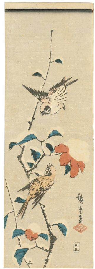
21. 雪中椿に雀 ¥480,000 天保頃 中短冊