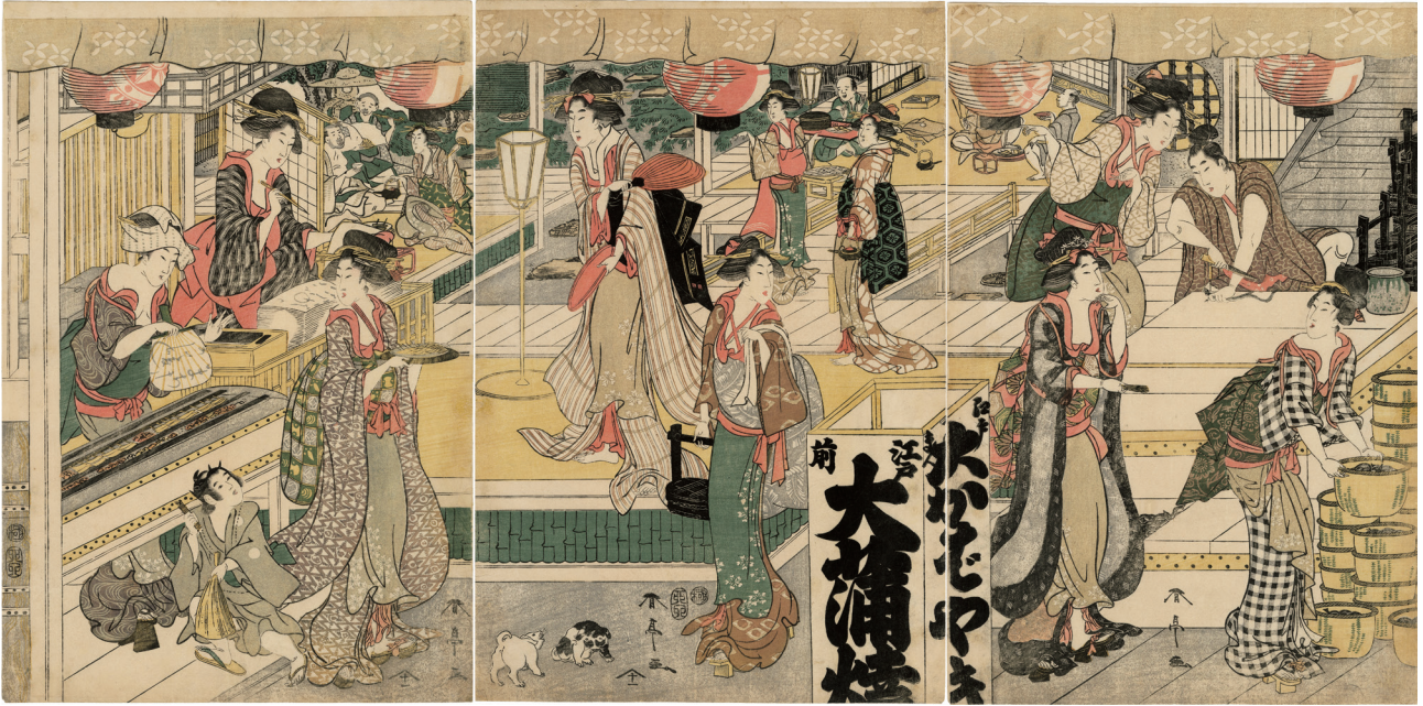
9. 江戸前大浦焼大和田 文化4年 少汚れ 小虫穴補修