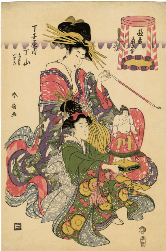
10. 遊君角力合 ¥720,000 文政2年 小虫穴補修 少汚れ