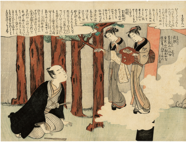
1. 序 お仙お藤の来迎 中折 一部に薄み ¥520,000