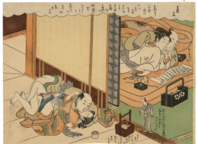
6. 十五 端折 少汚れ ¥420,000