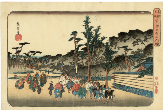
19. 東都名所芝増上寺山内ノ図 ¥240,000 天保 3 - 5 年 小虫穴補修 少汚れ