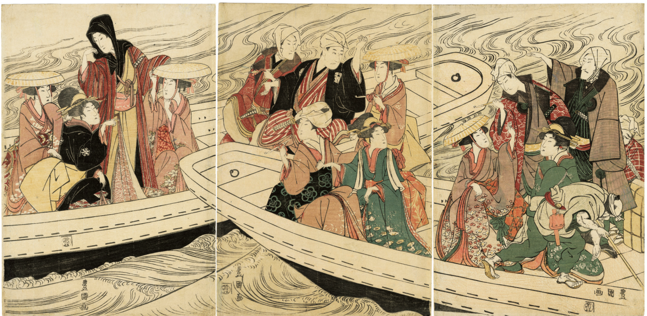
8. 川渡り図 少汚れ 小虫穴補修 端折

豊春は歌川派の祖で、芝字田川町に住んでいたことから歌川と名乗ったといわれる。豊春は中国の眼鏡絵や西洋の銅版画を浮世絵に模写して研究を重ね、やがて遠近法を習得。それをもって江戸の浮絵などを描いた。その活躍により、以後の浮世絵界を独占する一大勢力、歌川派が築かれた。