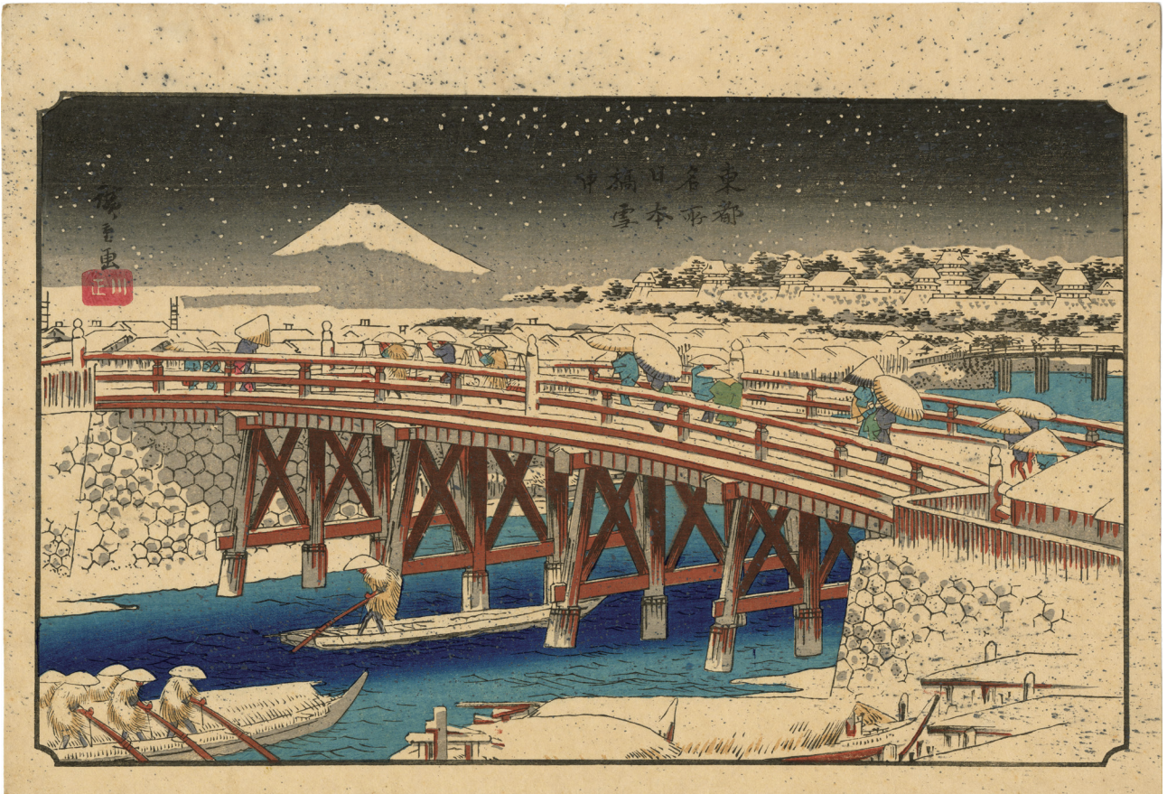
18. 東都名所日本橋雪中 天保 11 - 13 年 刷優良 マージンに小虫穴補修 少ヤケ 一部に薄み 胡粉散らし ¥650,000