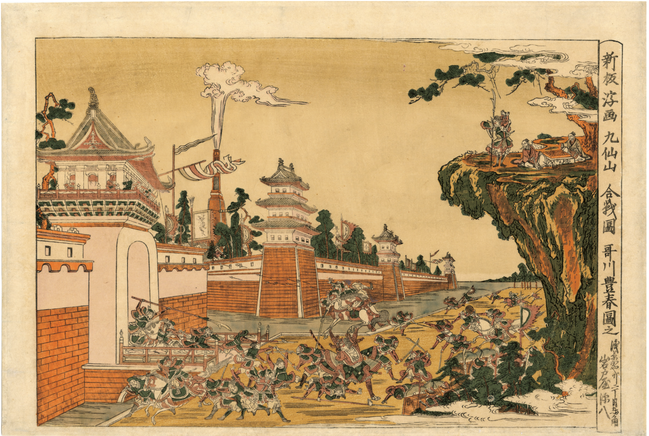
7. 新板浮画九仙山合戦圖 天明頃 刷優良 下部に付マージン * 囲碁の図