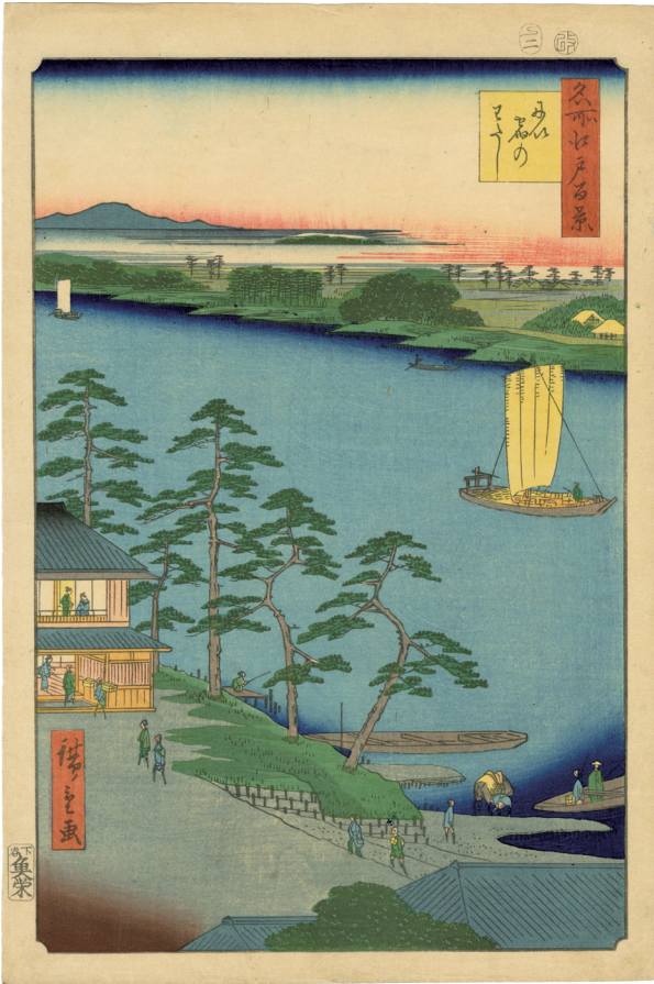
14. 名所江戸百景 にい宿の渡し ¥450,000 安政4年 マージンに少汚れ 極小虫穴