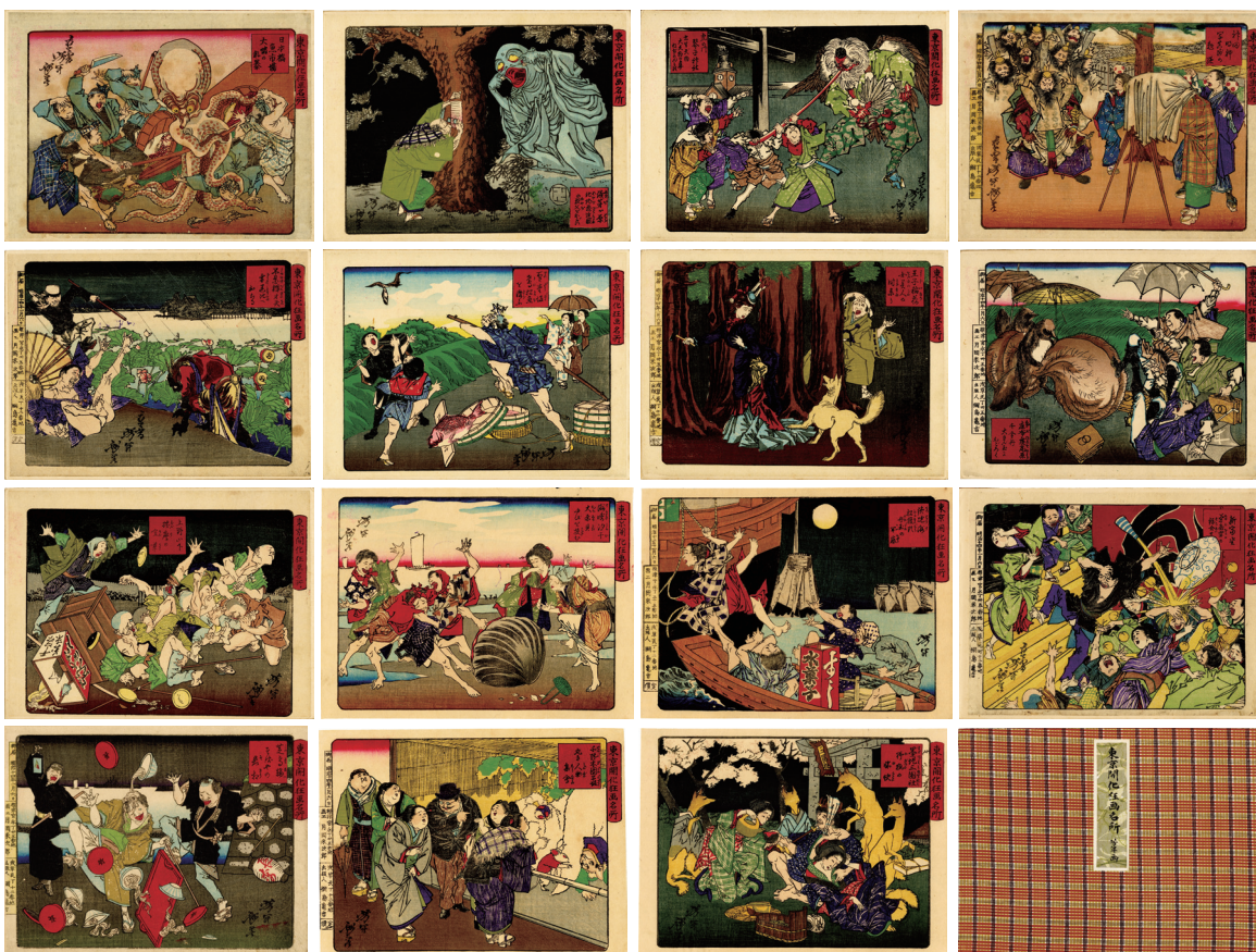
122. 東京開化狂画名所 明治14年 18.5 × 24.8 cm 画帳 (33図) 一部表示 少汚れ ¥320,000