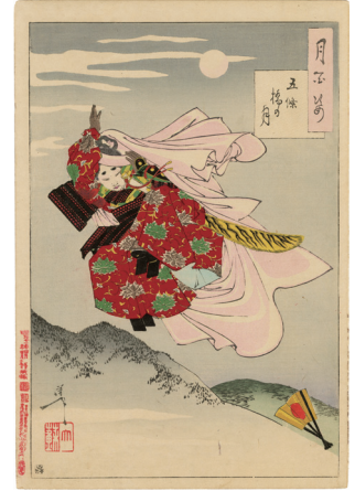
108. 五條橋の月 少汚れ 裏打 ¥65,000