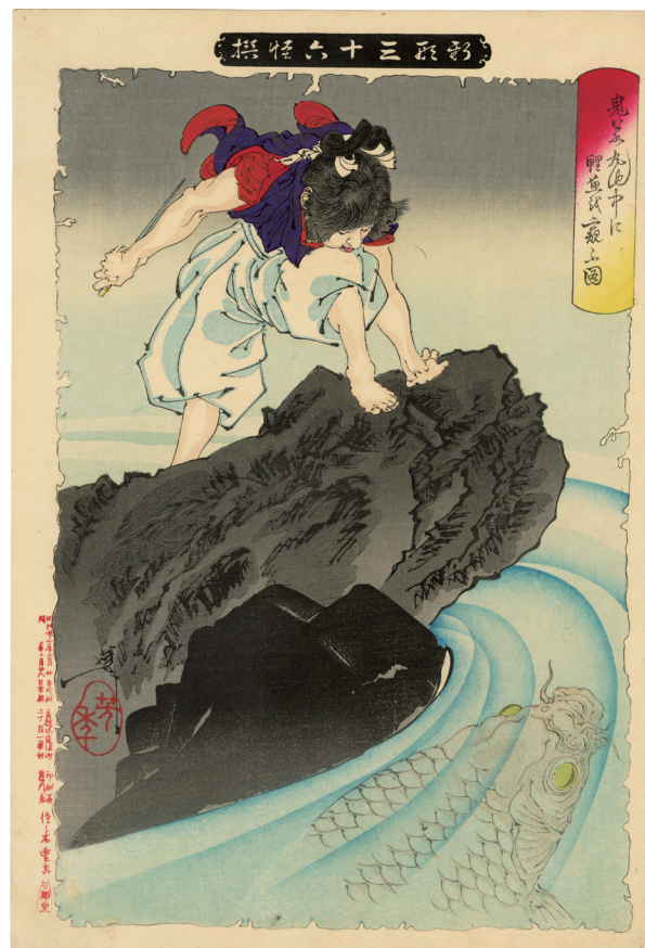
121. 新形三十六怪撰 鬼若丸池中に鯉魚を窺ふ図 明治22年 保存優良 ¥400,000