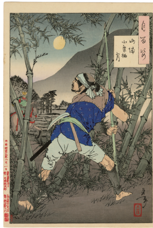
110. 山城小栗柄月 裏打 ¥60,000