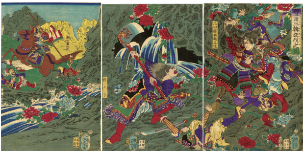
118. 豊臣三韓征伐之図 慶応2年 小虫穴補修 ¥100,000