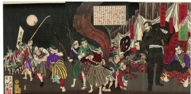
119. 鹿児島征討紀聞 明治10年 小虫穴補修 裏打 三枚貼り合わせ ¥50,000