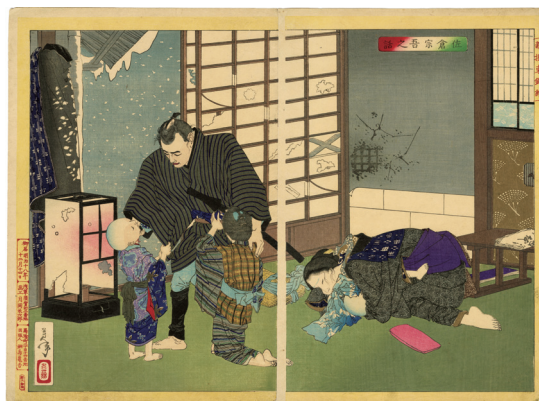
115. 新撰東錦絵 佐倉宗吾之話 明治 18 年 少汚れ ¥120,000