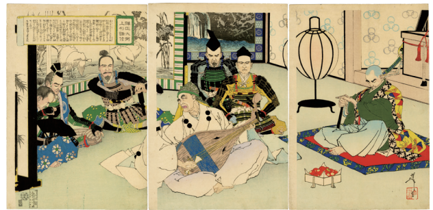
114. 弾正大弼 上杉謙信 明治 26 年 少汚れ