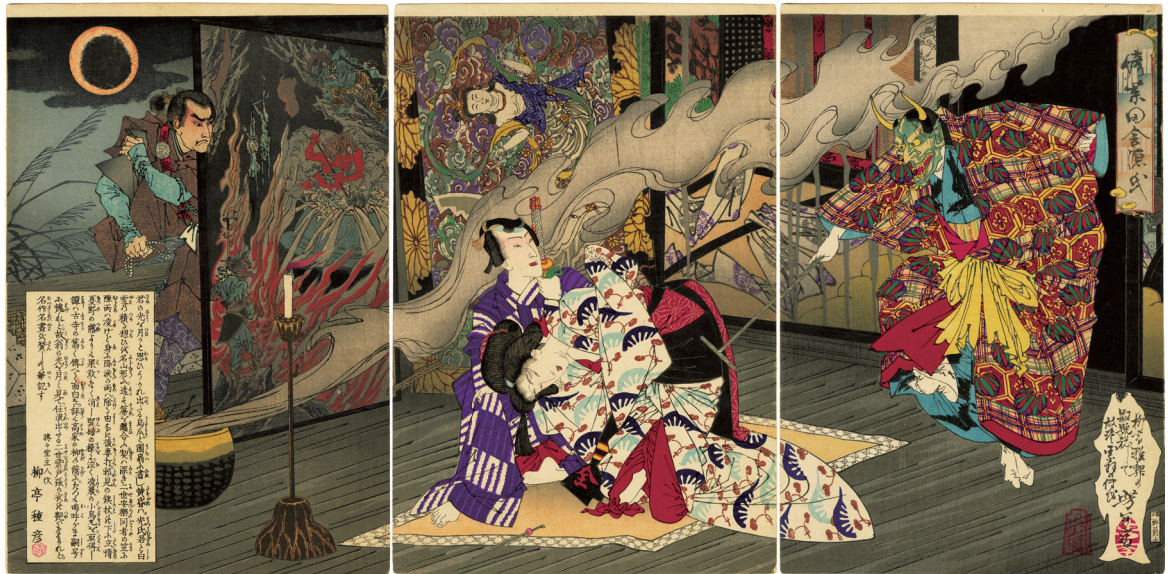
117. 偽紫田舎源氏 明治17年 裏打

芳年はこの伸びきった百日蔓の髪の毛を描くのに三日を費やしたという。そして、非常に細かい線で表現し得た彫師の手腕も見逃してはならない。横長の大きな画面を用いることで舞台の緊迫感を見事に伝えた晩年の代表作となっている。