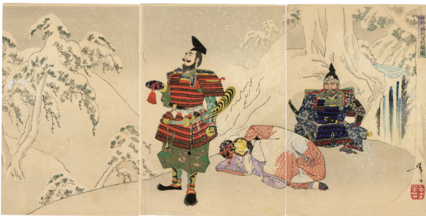
113. 芳野二静判官別離図 少汚れ