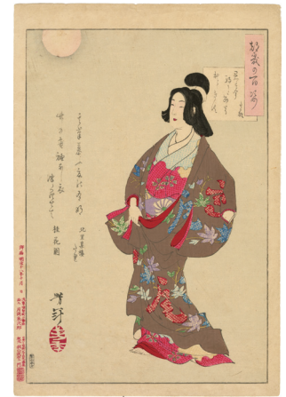
112. 君は今駒かたあたりほととぎす たか雄 少汚れ マージンに少ヤブレ ¥35,000