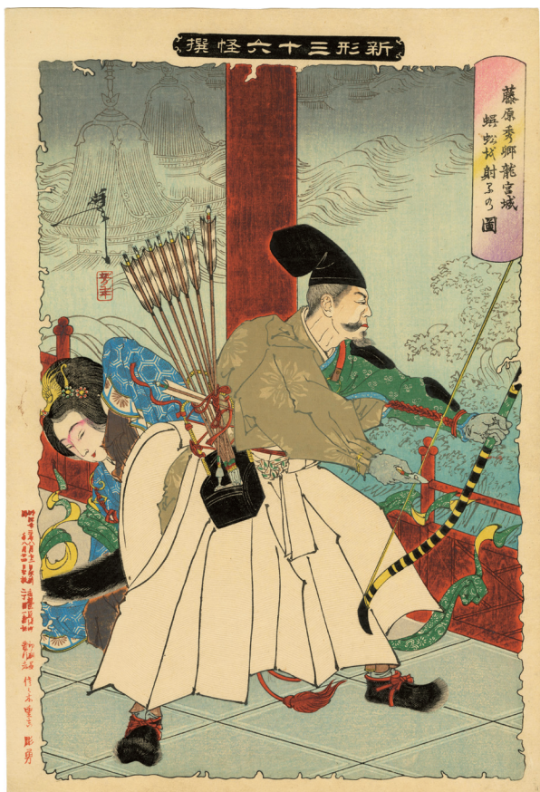
120. 新形三十六怪撰 藤原秀郷龍宮城蜈蚣を射る乃図 明治23年 刷優良 ¥400,000