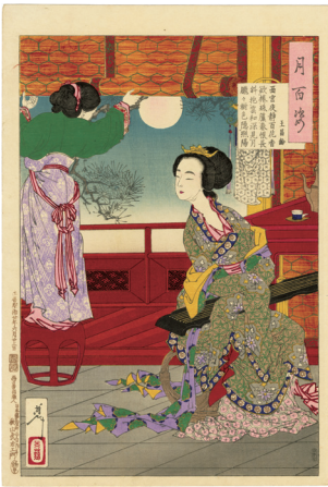
109. 西宮夜静百花香〜 王昌齡 刷優良 裏打 ¥70,000