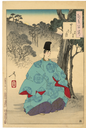
111. 世尊寺乃月 少将義孝 刷優良 少汚れ ¥45,000