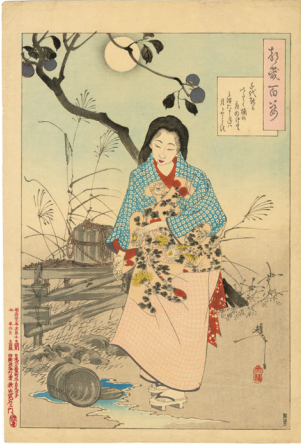
107. 千代能のかいたく桶の〜 校合摺とのセット 少汚れ