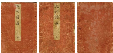
33. 天の浮橋 三冊揃 天保元年 各 25.8 × 18 cm 汚れ ¥340,000