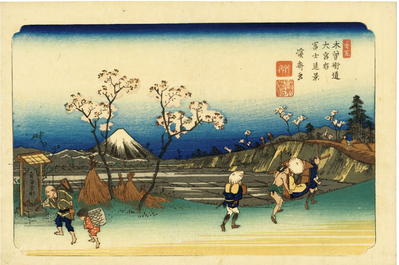
24. 木曾街道六十九次大宮 天保8年頃 刷優良 小虫穴補修