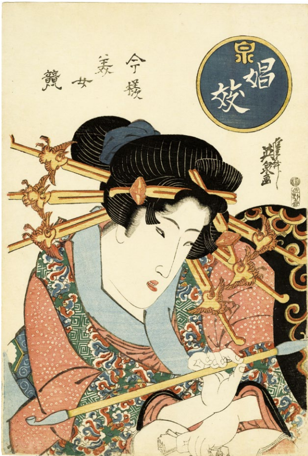
28. 今様美女競 文政期 小虫穴補修 ¥750,000