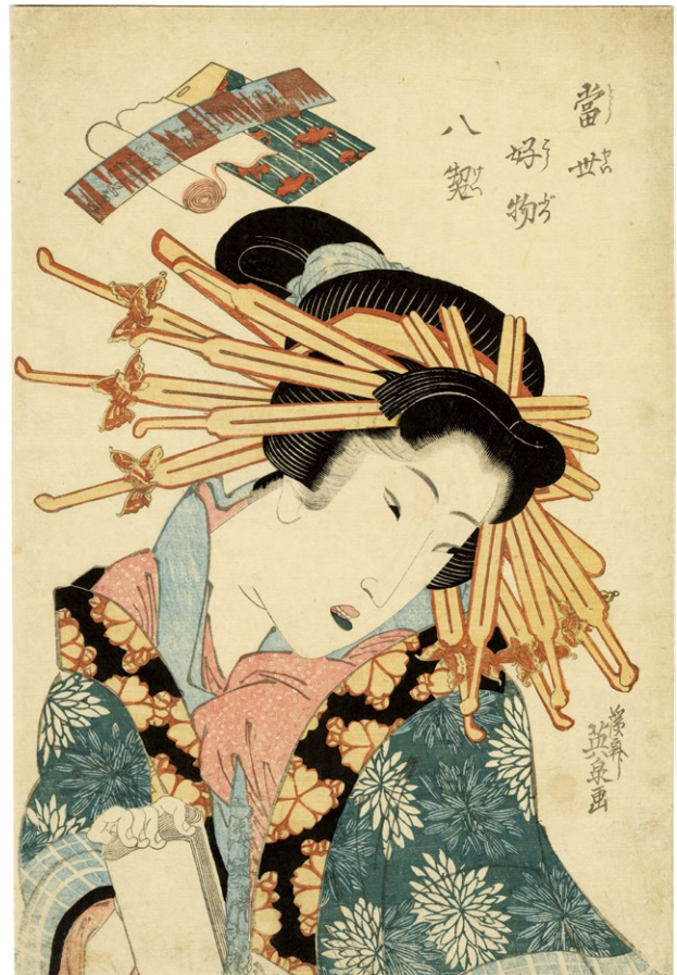
29. 当世好物八契 文政6年頃 少汚れ 虫穴補修 ¥360,000