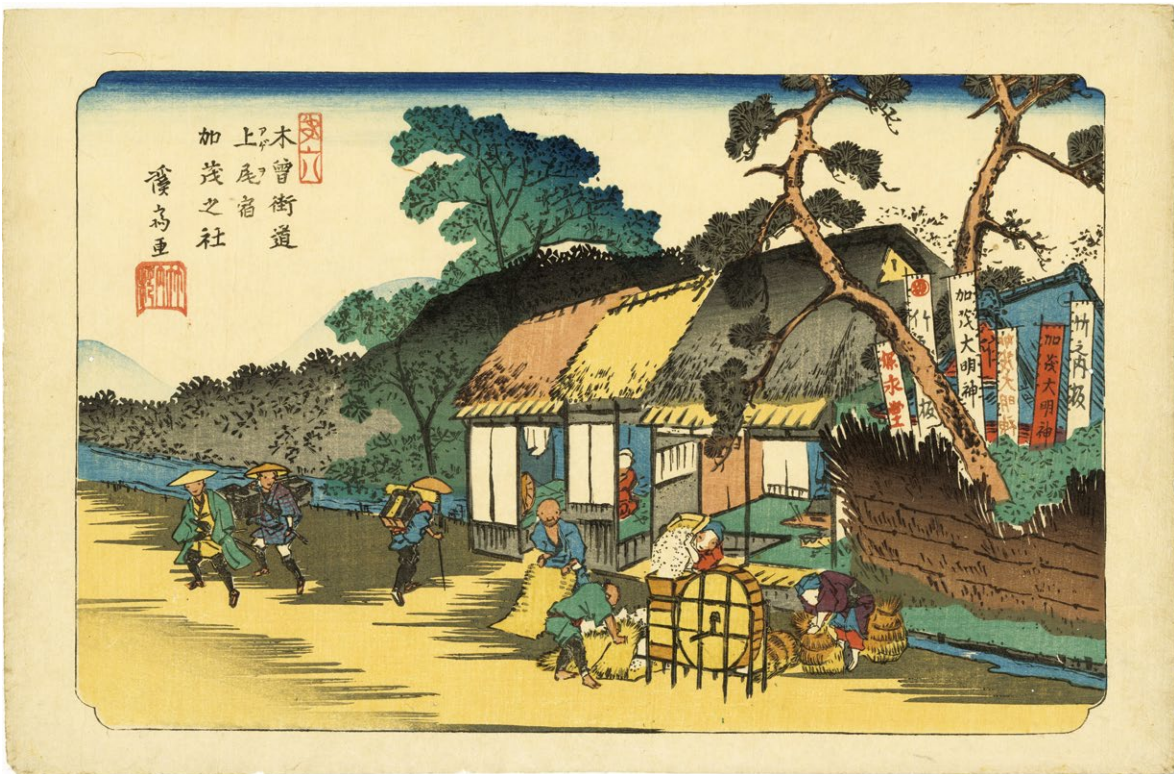
25. 上尾 刷優良 小虫穴補修 マージンに少汚れ