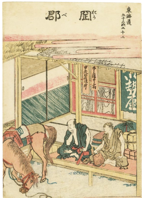
31. 東海道五十三次 岡部 中判 極小虫穴 ¥260,000