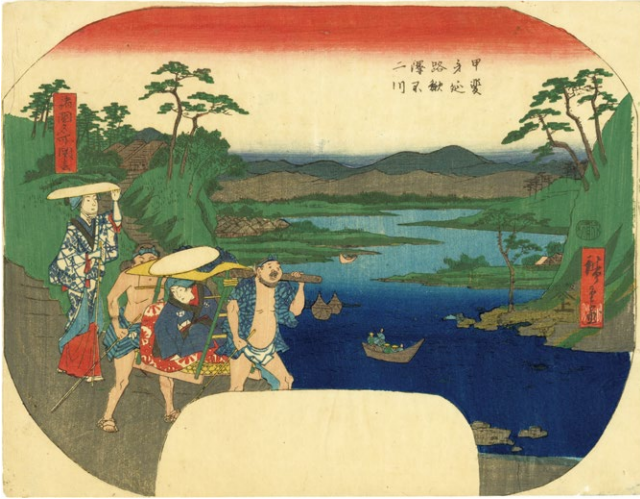
22. 諸国名所図会 甲斐身延路鰍澤不二川 文久2年 团扇絵 少汚れ 小虫穴 ¥380,000