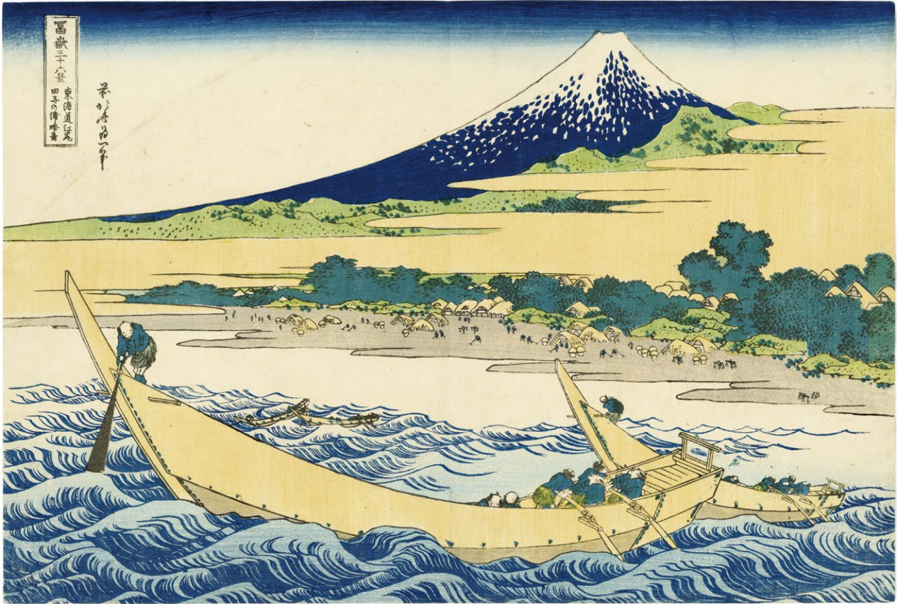
32. 富嶽三十六景 東海道江尻 田子の浦略図 中折 少汚れ 虫穴補修 ブラックライン