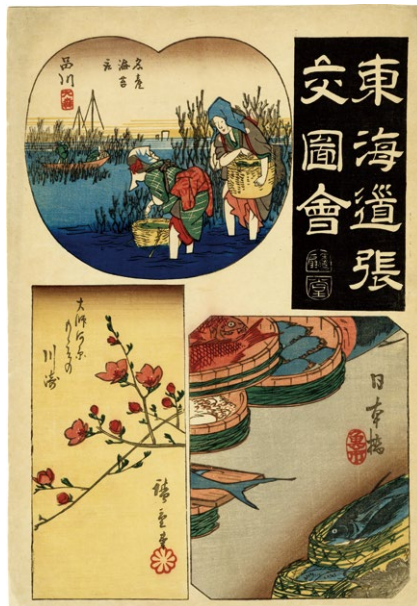
18. 東海道張交図会 日本橋 品川 川崎 嘉永5年 小虫穴補修 少汚れ ¥60,000