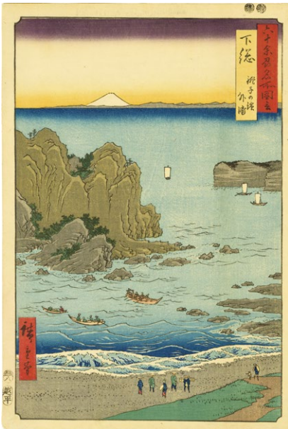
17. 六十余州名所図会 下総 銚子の浜 外浦 嘉永6年 マージンに書込跡 ¥280,000