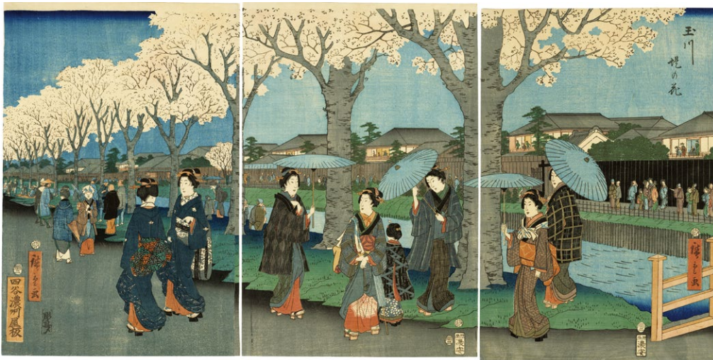
15. 玉川堤の花 安政3年 小虫穴補修 左図に中図の一部貼付