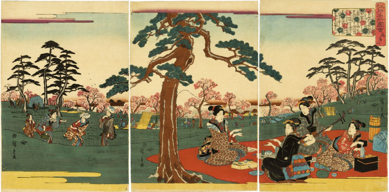
14. 江戸名所図会 飛鳥山 天保14 - 弘化4年 小虫穴補修 少汚れ