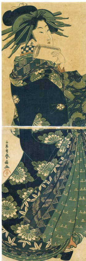
6. (藍刷美人) ¥170,000 ヤケ 少汚れ 小虫穴補修