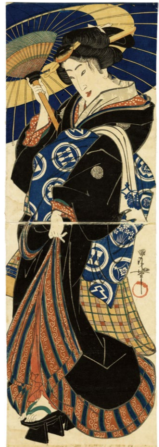
5. (傘持美人) ¥120,000 小虫穴補修 少汚れ