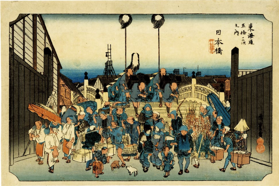
11. 日本橋 小虫穴補修 少汚れ ¥800,000