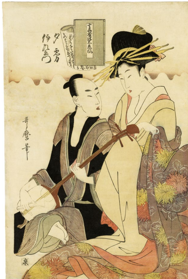
2. 其扇屋浮名恋風 夕霧 伊左衛門 文化3 - 天保2年 小虫穴 少汚れ 少シワ ¥800,000