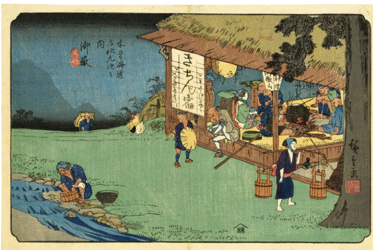
21. 木曾街道六十九次 御嶽 天保8年頃 中折 小穴補修 ¥320,000