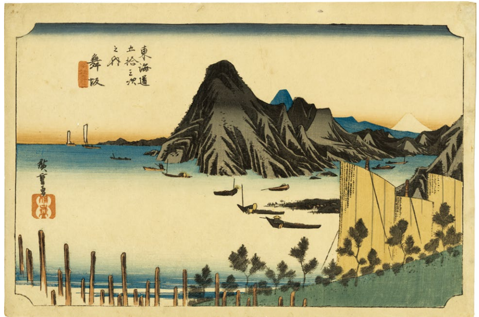
12. 舞坂 小虫穴補修 ¥240,000