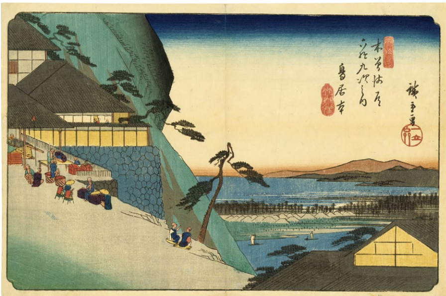
20. 木曾街道六十九次 鳥居本 天保8年頃 中折補修 少汚れ ¥400,000