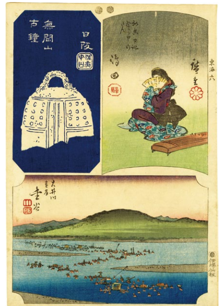
19. 東海道張交図会 島田 金谷 日阪 弘化4 - 嘉永5年 少汚れ 小虫穴補修 ¥40,000