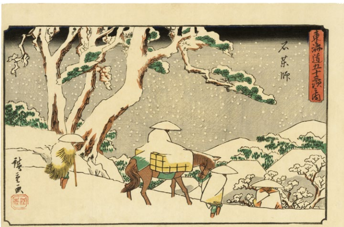
13. 東海道五十三次(行書) 石葉師 天保12-13年 間判 小虫穴補修 ¥360,000