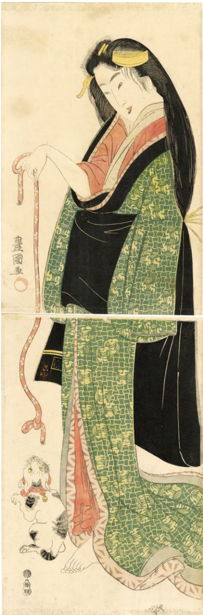
3. (猫と戯れる美人) ¥450,000 文化頃 少汚れ 小虫穴補修 端折