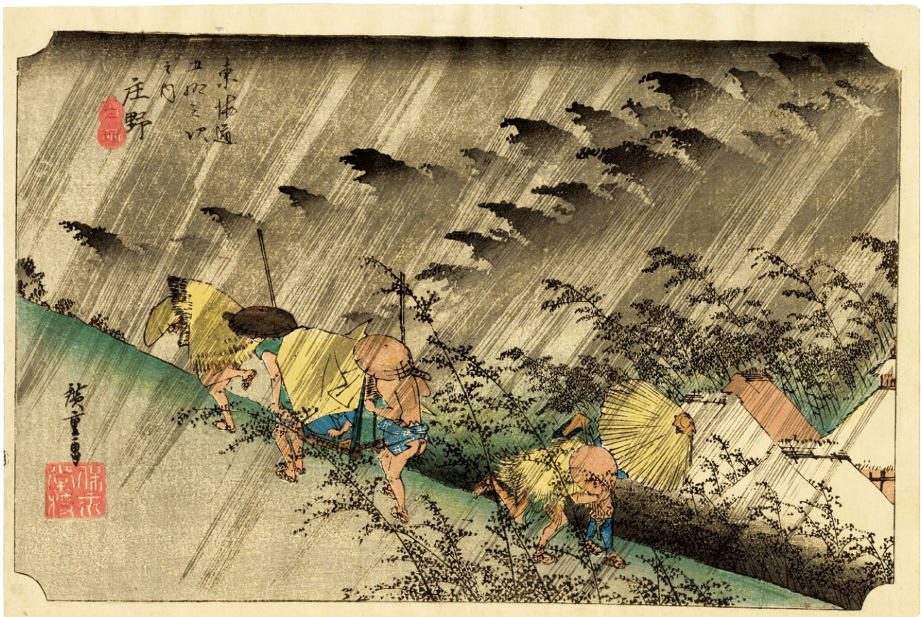
10. 庄野 小虫穴補修