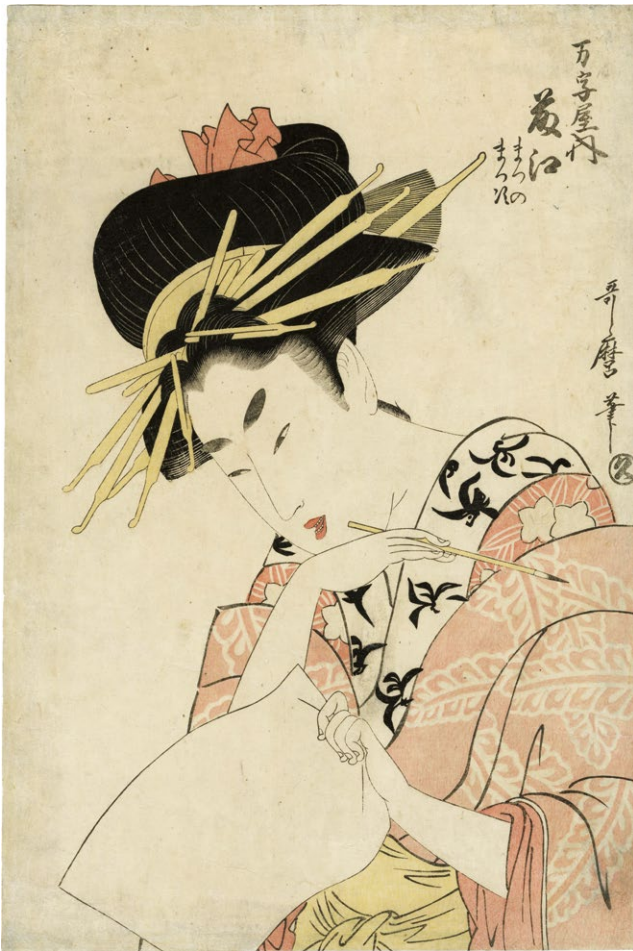
1. 万字屋内藤江 まつの まつき 安永4 - 文化3年 汚れ 小虫穴補修 ¥750,000