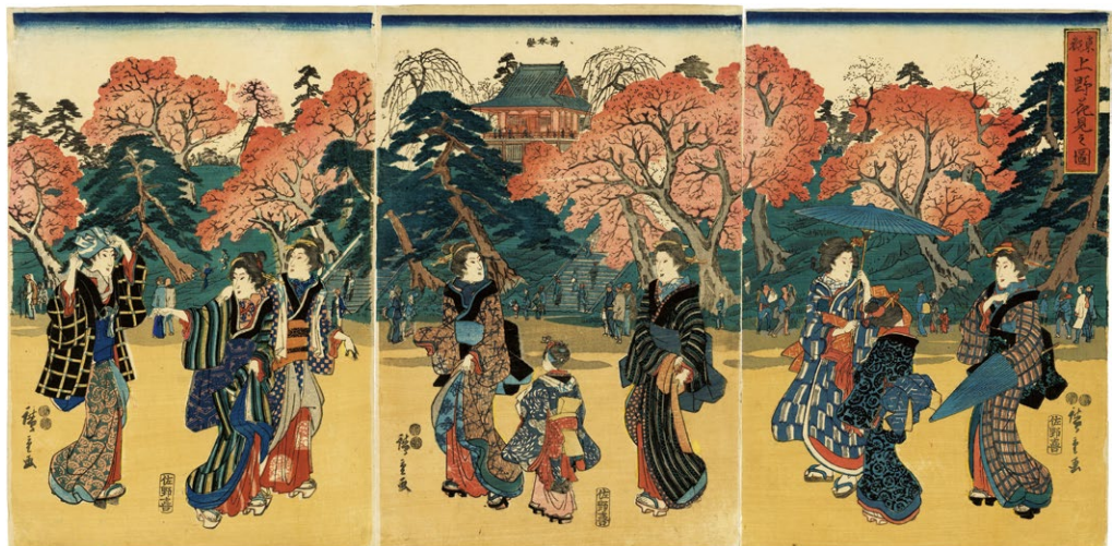
16. 東都上野花見之図 弘化4 - 嘉永5年 刷並 少汚れ 一部に薄み