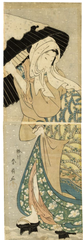
7. (雪中傘持美人) ¥100,000 少汚れ 小虫穴