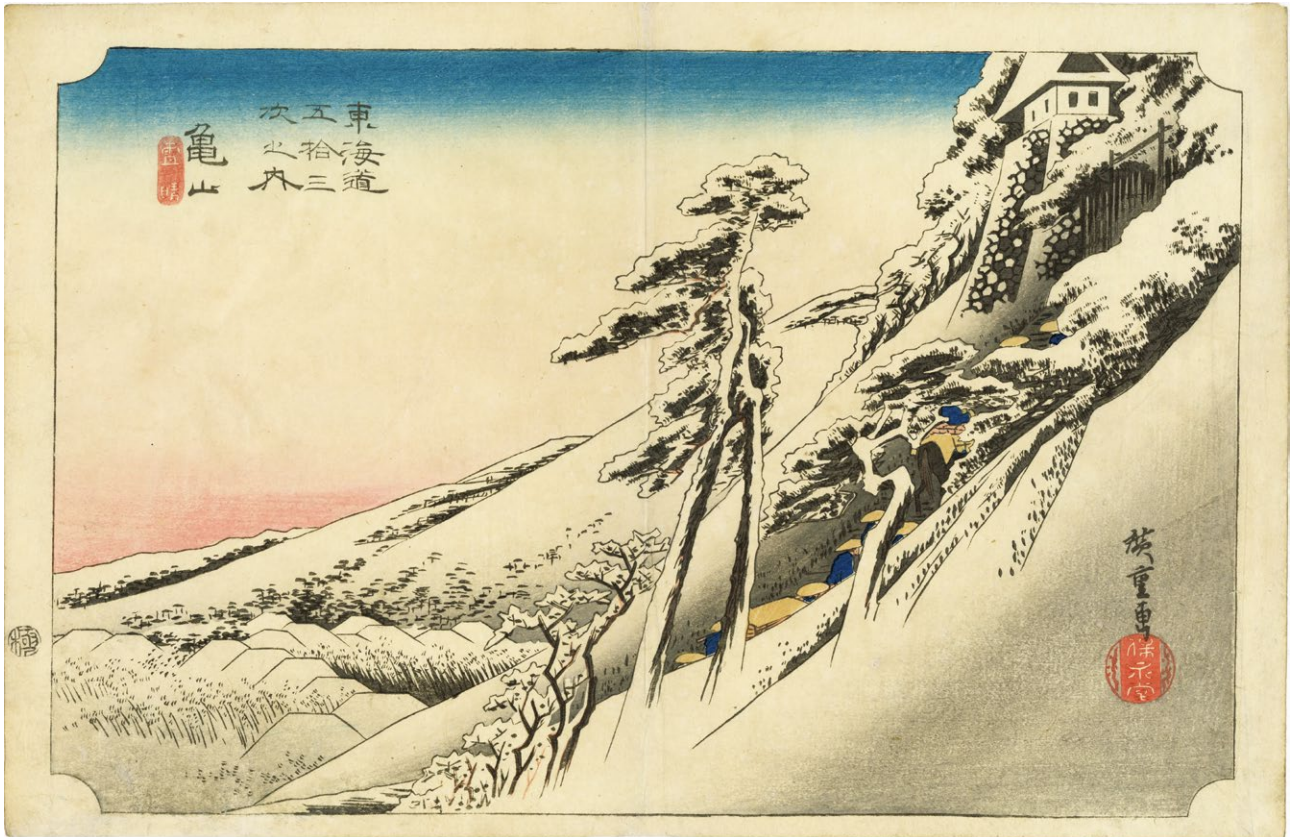
9. 亀山 中折 少汚れ 小穴補修