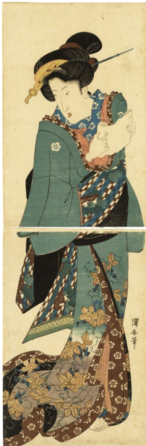
4. (文読み美人) ¥140,000 少汚れ 一部に薄み